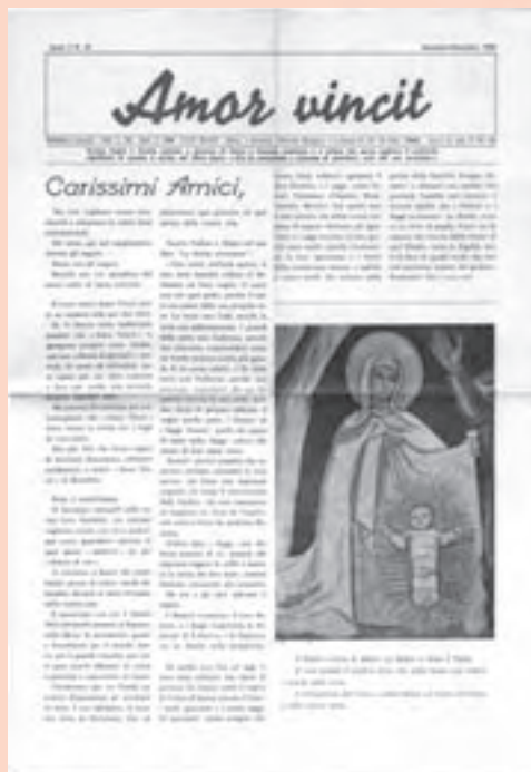
La copertina dell'“Amor vincit” di novembre-dicembre 1962

A me sembra che tre siano principalmente le idee-forza che maturarono in lei dal Concilio e che trovano nel periodo abbondante testimonianza. Dico “maturarono”, perché erano già nella sua anima e nella sua Opera. Sono: la centralità dell'Eucaristia necessaria all'opera caritativa; la dimensione universale della missione; la partecipazione dei laici dentro una nuova coscienza ecclesiale.