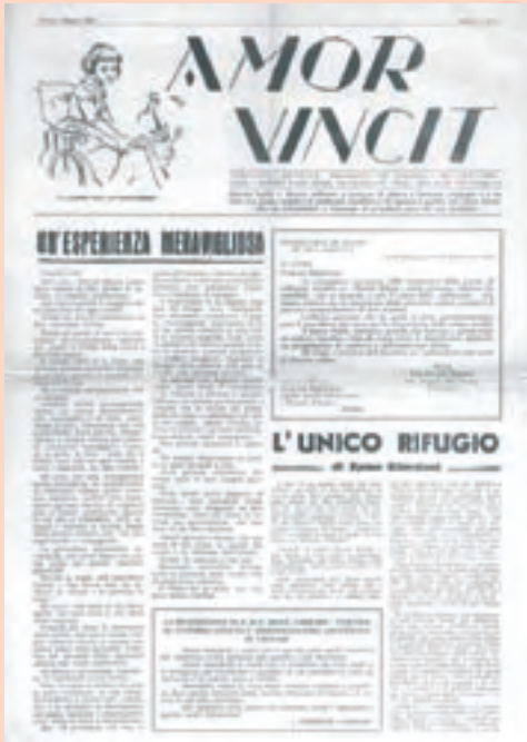
Il primo numero de "L'amore vince"

Il 1958, anno di uscita del primo numero,