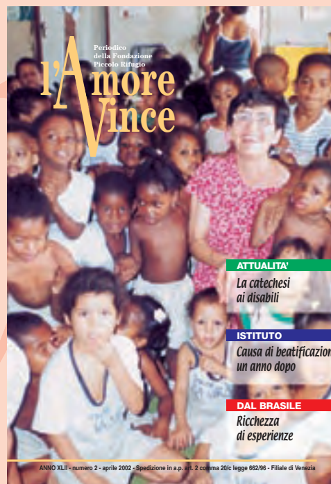
Dedicata alle missioni in Brasile la copertina de “L'Amore vince” di aprile 2002