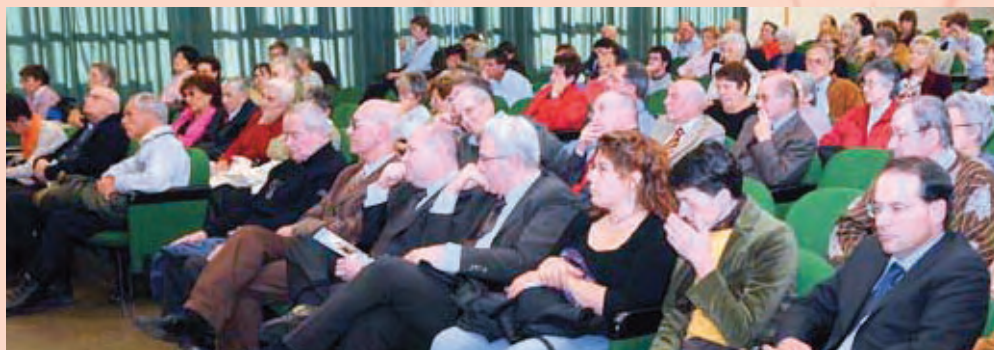
Il pubblico al convegno

Presenti al convegno "La voce dell'amore" pure delegazioni dei Piccoli Rifugi di San Donà di Piave, Trieste, Ponte della Priula, Verona, Vittorio Veneto.