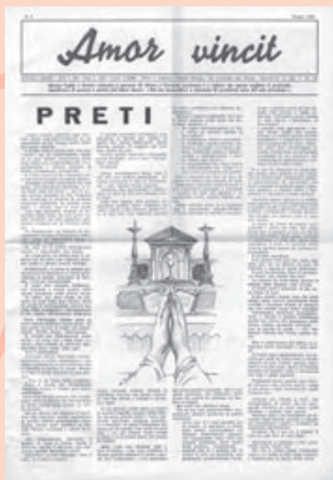
“Amor vincit” del maggio 1960

L’Eucaristia, mistero della carità di Cristo, è l’energia d’amore che produce la dedizione ai fratelli. Dall’Eucaristia sono nati i Piccoli Rifugi, le case di accoglienza per le donne che uscivano dalla prostituzione, e in seguito gli ospizi per i lebbrosi e per ogni altra forma di povertà. E’ nato il coraggio di affrontare i