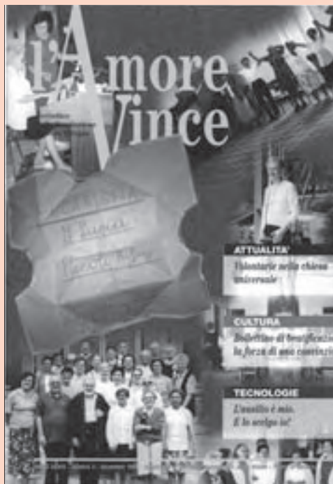
Dedicata alle Volontarie della Carità la prima pagina de "L'Amore vince" del novembre 1999

Attorno ai Piccoli Rifugi e alle varie opere di carità hanno sempre gravitato e cooperato i laici, uomini e donne: sia impegnandosi con una premessa accanto alle consacrate, sia respirando la spiritualità di Mamma Lucia. Ella, che nell'anima aveva costantemente coltivato l'ansia di spingere tutti alla perfezione evangelica della carità, mentre affidava i Piccoli Rifugi a persone consacrate